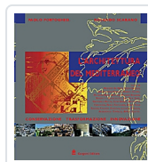
L'architettura del Mediterraneo Portoghesi, Paolo; Scarano, Rolando