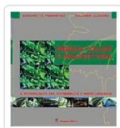
Energia solare e architettura Piemontese, Antonietta; Scarano, Rolando