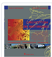
L'architettura del Mediterraneo Portoghesi, Paolo; Scarano, Rolando