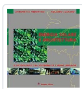
Energia solare e architettura Piemontese, Antonietta; Scarano, Rolando