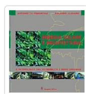
Energia solare e architettura Piemontese, Antonietta; Scarano, Rolando