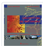
L'architettura del Mediterraneo Portoghesi, Paolo; Scarano, Rolando