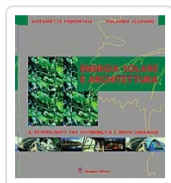
Energia solare e architettura Piemontese, Antonietta; Scarano, Rolando