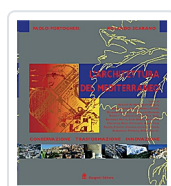
L'architettura del Mediterraneo Portoghesi, Paolo; Scarano, Rolando