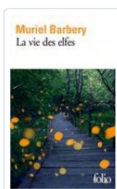
La vie des elfes Barbery, Muriel