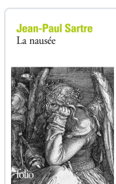
La Nausee Sartre, Jean Paul