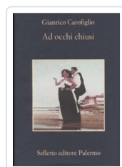
Ad occhi chiusi Carofiglio, Gianrico