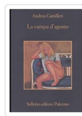
La vampa di agosto Camilleri, Andrea