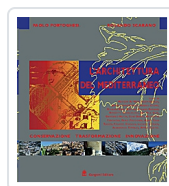
L'architettura del Mediterraneo Portoghesi, Paolo; Scarano, Rolando