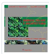
Energia solare e architettura Piemontese, Antonietta; Scarano, Rolando