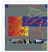
L'architettura del Mediterraneo Portoghesi, Paolo; Scarano, Rolando