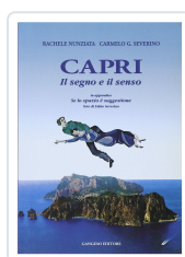
Capri - Il segno e il senso Nunziata, Rachele; Severino, Carmelo G.