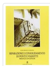
Riparazione e consolidamento di ponti e viadotti Lamanna, Luigi Franco