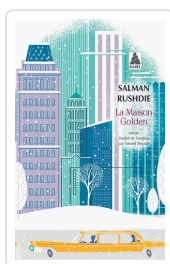
La maison Golden Rushdie, Salman