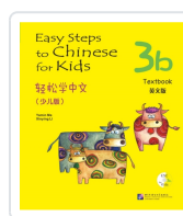
Easy Steps to Chinese for Kids 3B - Textbook - Incluye código QR Ma, Yamin