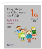
Easy steps to Chinese for Kids 1A - Workbook Ma, Yamin