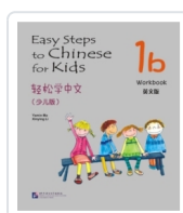
Easy Steps to Chinese for Kids 1B - Workbook Ma, Yamin