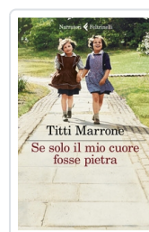
Se solo il mio cuore fosse pietra Marrone Titti