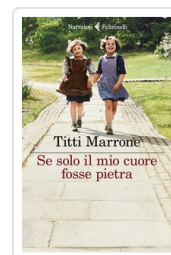
Se solo il mio cuore fosse pietra Marrone Titti