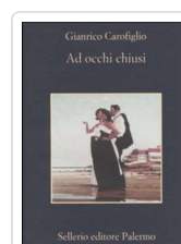
Ad occhi chiusi Carofiglio, Gianrico