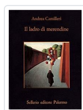
Il ladro di merendine Camilleri, Andrea