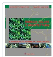
Energia solare e architettura Piemontese, Antonietta; Scarano, Rolando