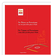
Da Tiziano al futurismo - Du Titien au futurisme Strinati, Claudio