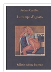
La vampa di agosto Camilleri, Andrea