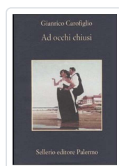
Ad occhi chiusi Carofiglio, Gianrico