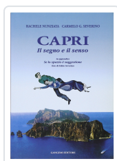
Capri - Il segno e il senso Nunziata, Rachele; Severino, Carmelo G.