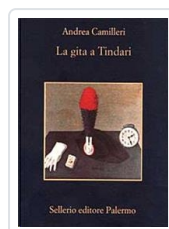
La Gita a Tindari Camilleri, Andrea