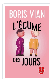
L'écume des jours Vian, Boris