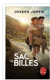
Un sac de billes Joffo, Joseph