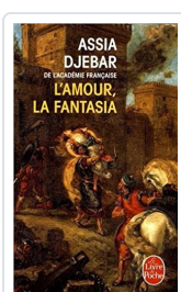
L'amour, la fantasia Djebar, Assia