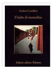
Il ladro di merendine Camilleri, Andrea