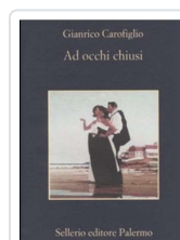
Ad occhi chiusi Carofiglio, Gianrico