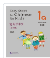
Easy steps to Chinese for Kids 1A - Workbook Ma, Yamin