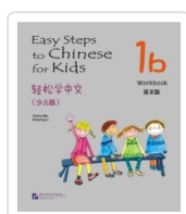
Easy Steps to Chinese for Kids 1B - Workbook Ma, Yamin