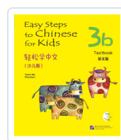
Easy Steps to Chinese for Kids 3B - Textbook - Incluye código QR Ma, Yamin