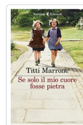
Se solo il mio cuore fosse pietra Marrone Titti