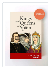
Baraja Kings and Queens of Spain AA.VV.