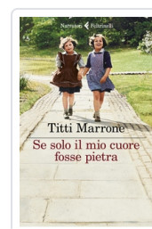
Se solo il mio cuore fosse pietra Marrone Titti