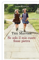
Se solo il mio cuore fosse pietra Marrone Titti