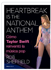
Heartbreak is the National Anthem. Cómo Taulor Swift reinventó la música pop. Sheffield, Rob