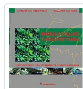
Energia solare e architettura Piemontese, Antonietta; Scarano, Rolando