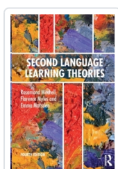
Second Language Learning Theories, 4ed. Mitchell, Rosamond