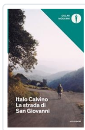
La strada di San Giovanni Calvino, Italo