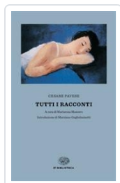
Tutti i racconti Pavese, Cesare