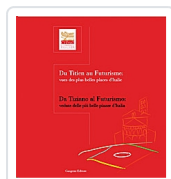
Da Tiziano al futurismo - Du Titien au futurisme Strinati, Claudio