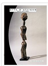
Arts d'Afrique Dandrieu-Giovagnoni, Chantal