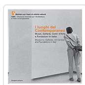
I Luoghi del Contemporaneo - Bilingüe It-Ing) Mosca, Antonella