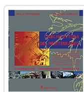
L'architettura del Mediterraneo Portoghesi, Paolo; Scarano, Rolando