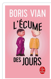
L'écume des jours Vian, Boris