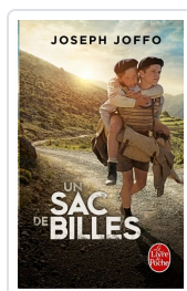
Un sac de billes Joffo, Joseph