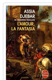
L'amour, la fantasia Djebar, Assia