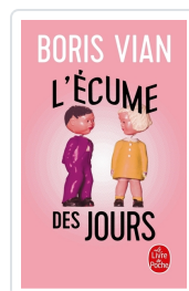
L'écume des jours Vian, Boris