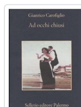
Ad occhi chiusi Carofiglio, Gianrico