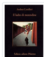
Il ladro di merendine Camilleri, Andrea