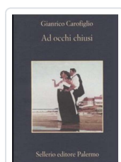
Ad occhi chiusi Carofiglio, Gianrico