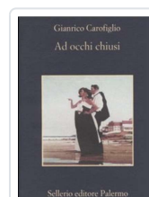
Ad occhi chiusi Carofiglio, Gianrico