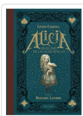
Alicia en el País de las Maravillas Carroll, Lewis