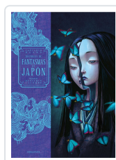
Cuentos de Fantasmas de Japon Hearn, L. / Lacombe, B.