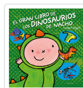
El gran libro de los dinosaurios de Nacho Slegers, Liesbet