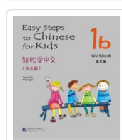
Easy Steps to Chinese for Kids 1B - Workbook Ma, Yamin