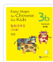
Easy Steps to Chinese for Kids 3B - Textbook - Incluye código QR Ma, Yamin