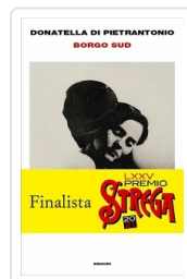
Borgo Sud Pietrantonio, Donatella di