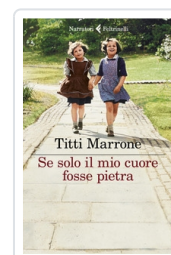
Se solo il mio cuore fosse pietra Marrone Titti