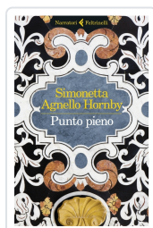
Punto pieno Agnello Hornby, Simonetta