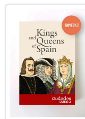
Baraja Kings and Queens of Spain AA.VV.