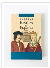
Baraja Parejas Reales de España AA.VV.