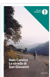
La strada di San Giovanni Calvino, Italo