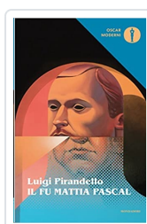
Il Fu Mattia Pascal Pirandello, Luigi