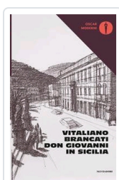
Don Giovanni in Sicilia Brancati, Vitaliano