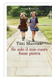
Se solo il mio cuore fosse pietra Marrone Titti