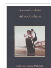
Ad occhi chiusi Carofiglio, Gianrico