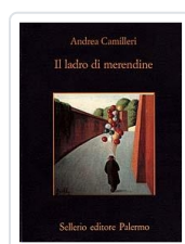
Il ladro di merendine Camilleri, Andrea