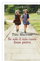
Se solo il mio cuore fosse pietra Marrone Titti