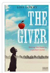
The Giver Lowry, Lois